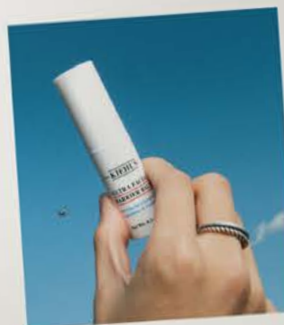
Barrierestarke Inhaltsstoffe wie Squalan und Pro-Ceramide: Ultra Facial Barrier Balm von Kiehl's

Für einen sommerlichen Teint ohne schädliche Sonnenstrahlen ist das IT Cosmetics Glow With Confidence Sun Blush perfekt. Es verleiht der Haut einen natürlichen, strahlenden Glow und lässt sich leicht auftragen. Einfach das Blush auf die Wangenknochen auftragen, um einen frischen, sonnengeküssten Look zu erzielen und mit der Sonne um die Wette strahlen.