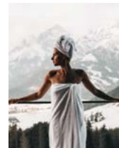
Das Allerschönste jedoch? Immer der Blick auf die Berge.

Von unserem Balkon aus können wir sogar schon die Rehe und Hirsche sehen, die wir gleich füttern werden. Mit einem Korb Gebäck in der Hand geht's gemeinsam mit den anderen Gästen nur unter uns die Esel, den Stier, die Ponys und das Rotwild. So lange, bis die Sonne das gesamte Tal in sanftes Morgenlicht taucht, und noch ein bisschen länger.