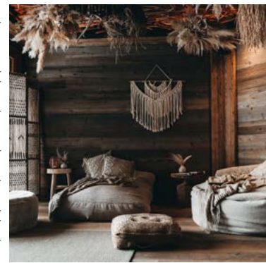
Ich denke an Reisen