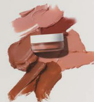
Sonnengeküst auch an Regentagen mit dem Glow with Confidence Sun Blush von IT Cosmetics